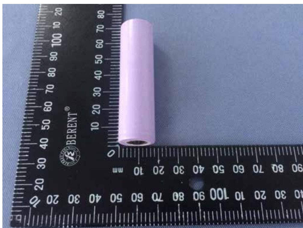
Fig. 2 Översikt II av cellen