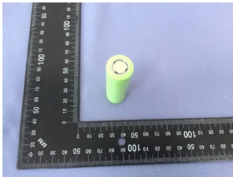
Fig.2 Vista geral II da célula