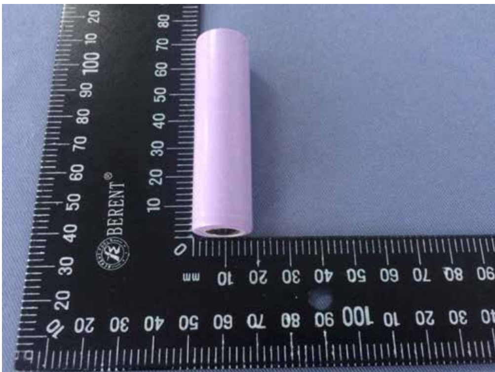
Kuva 2 Kennon yleiskuva II